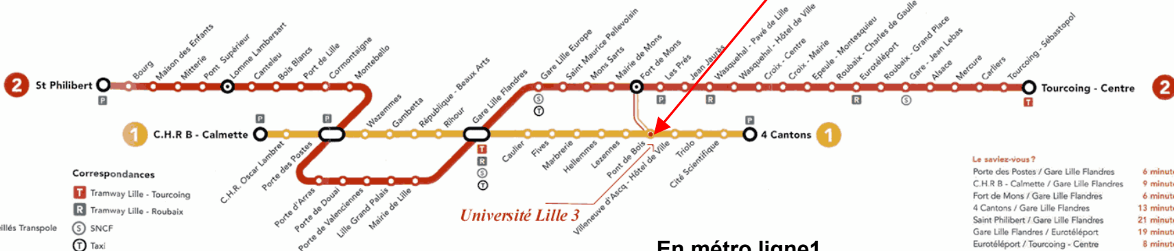
En métro ligne 1