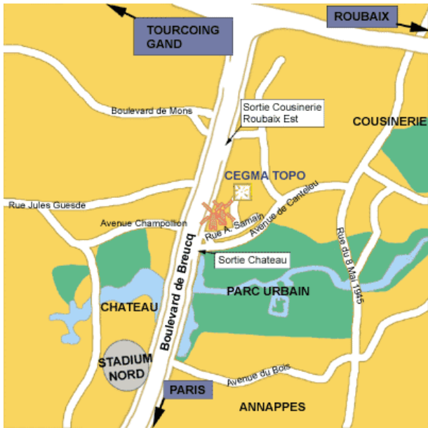
En voiture ou en taxi (suivre P7)